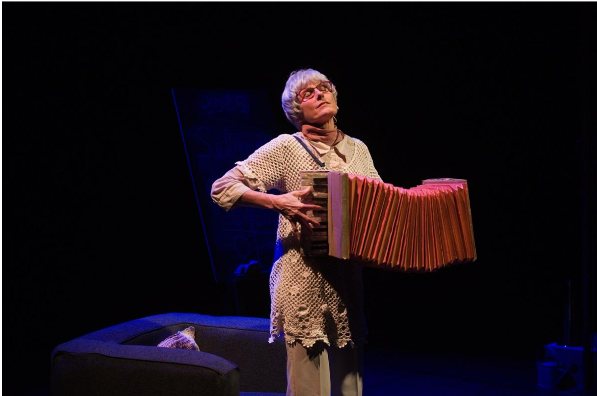
QUAND J'ÉTAIS VIEILLE

Quand j'étais vieille est un voyage à travers les âges, une rencontre au coin de la ride entre Geneviève 90 ans et Selma 10 ans.