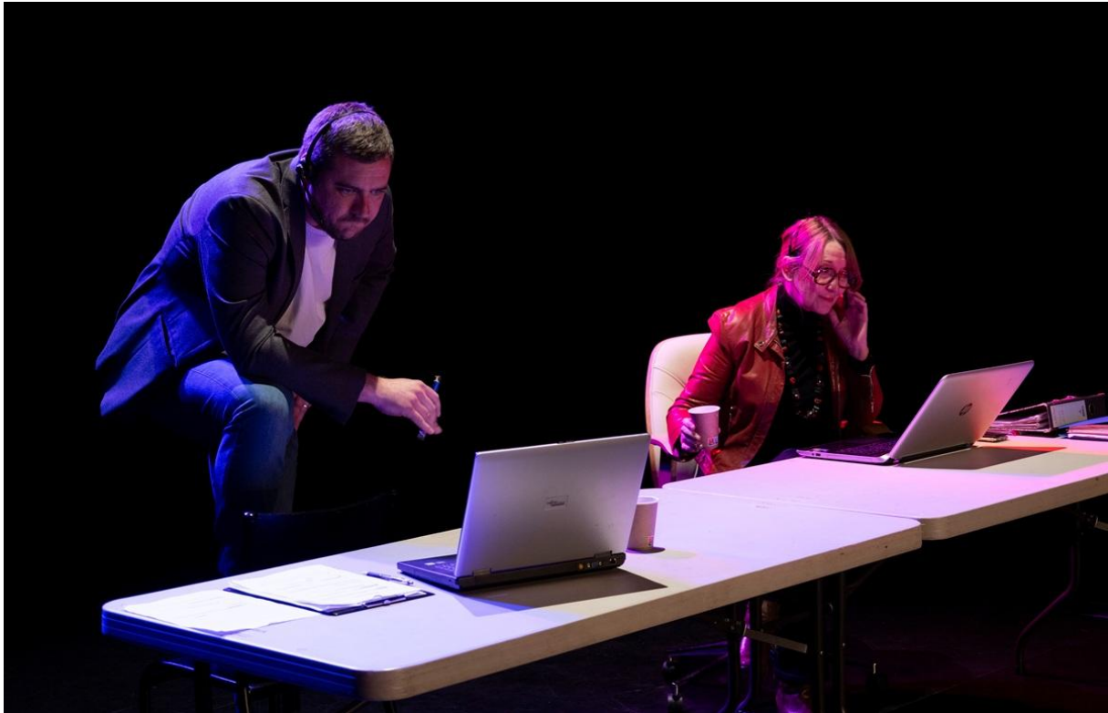
DÉMOCRATIE, J'ÉCRIS TON NOM

Tout le monde croit savoir ce qu'est la démocratie. Mais derrière les institutions, elle est surtout une affaire de comportements, de débats, de vigilance.