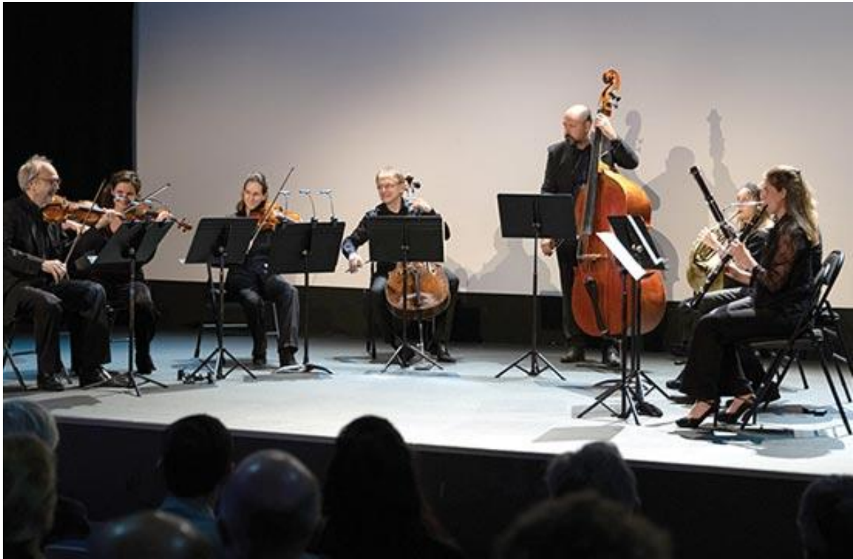
MUSIQUE CLASSIQUE DANS LES JEUX VIDÉOS